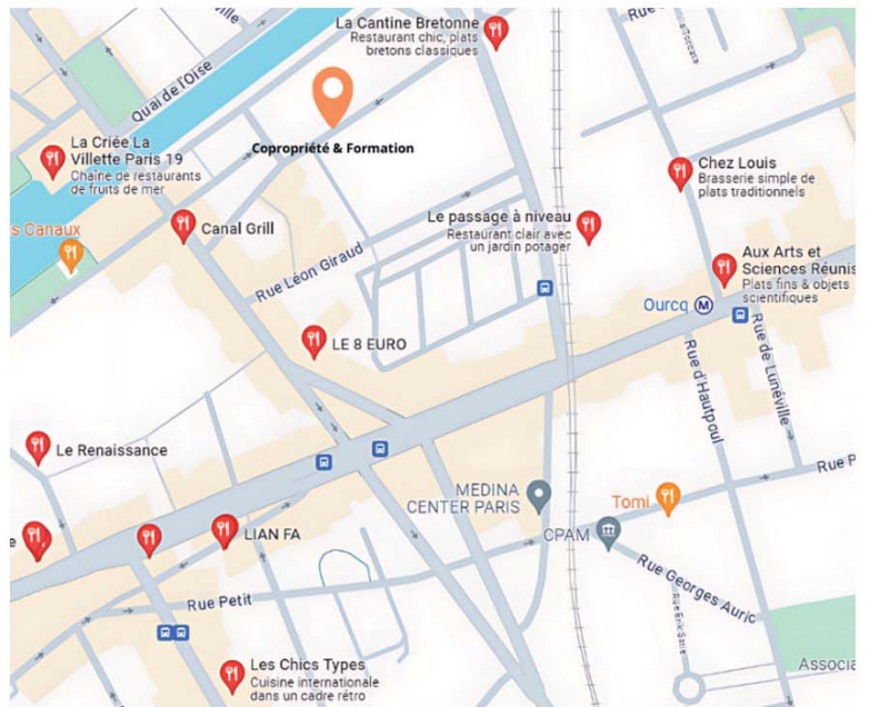
Restaurants à proximité de nos locaux.