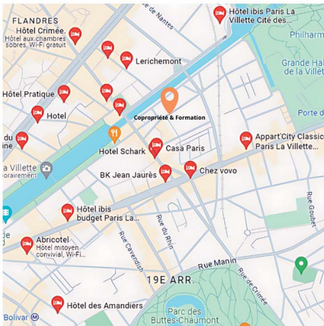
Hôtels et hébergements à proximité de nos locaux.

Les locaux de Copropriété et Formation se situent dans un quartier animé du 19 ème arrondissement de Paris. Vous y trouverez facilement de quoi vous restaurer et vous héberger.